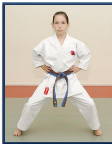
KIBA DACHI (BIS)