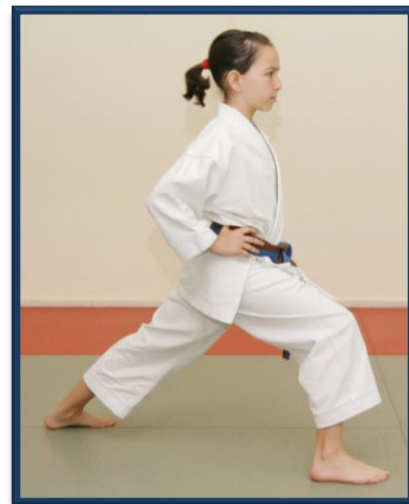
ZENKUTSU DACHI (BIS)