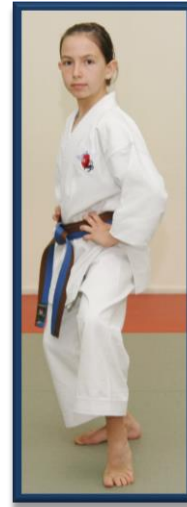
NEKO ASHI DACHI (BIS)