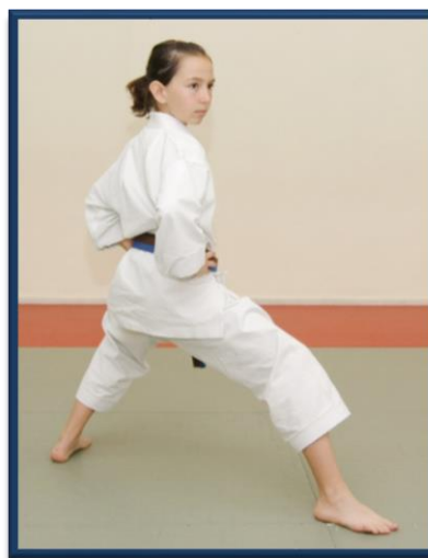
KOKUTSU DACHI (BIS)