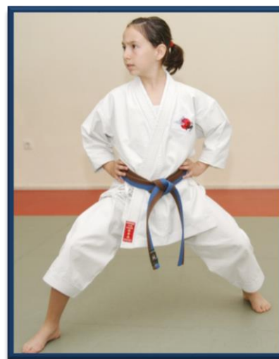
FUDO DACHI (BIS)