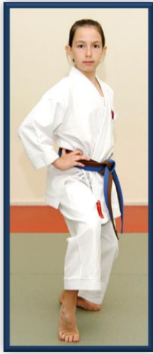
NEKO ASHI DACHI