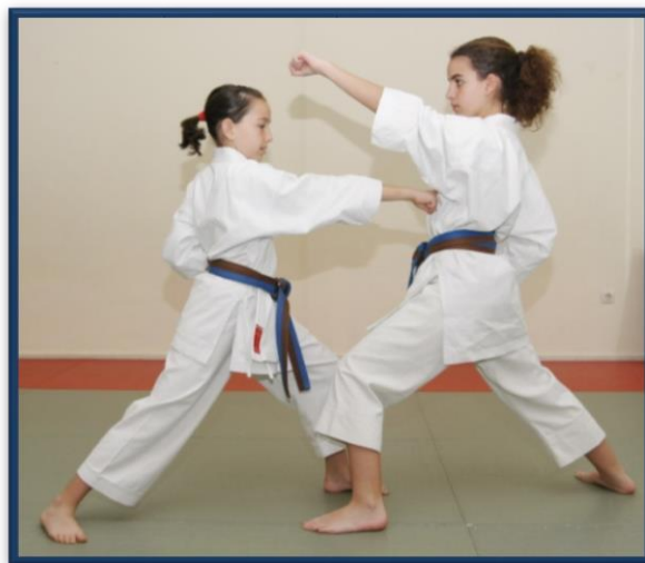
AGE UKE + GYAKU TSUKI