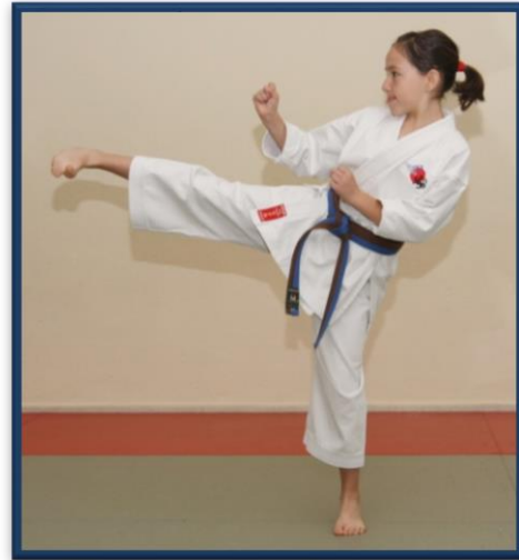
YOKO GERI KEKOMI