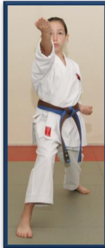
SHUTO UCHI YODAN