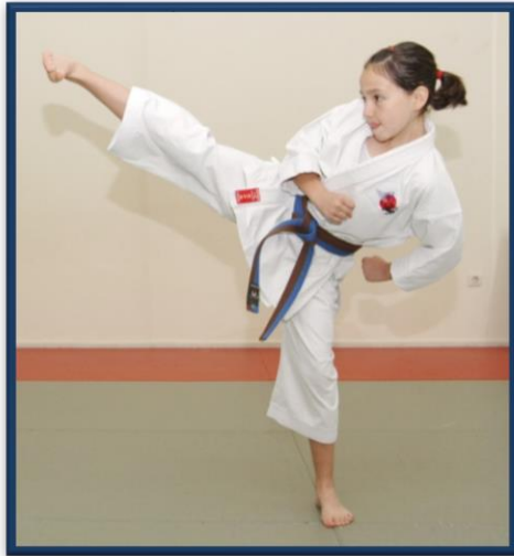
YOKO GERI KEAGE