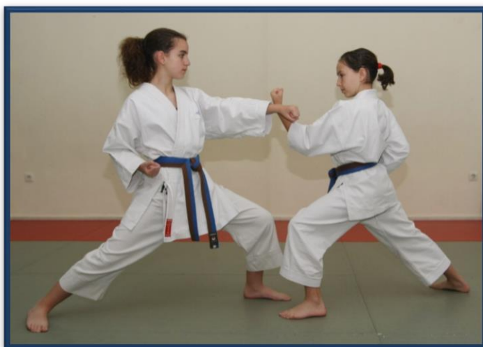
OI TSUKI CHUDAN

UKE (defensor)-> Uchi uke + Gyaku uraken uchi