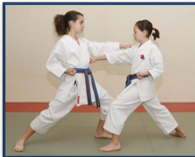
SOTO UKE + GYAKU TSUKI