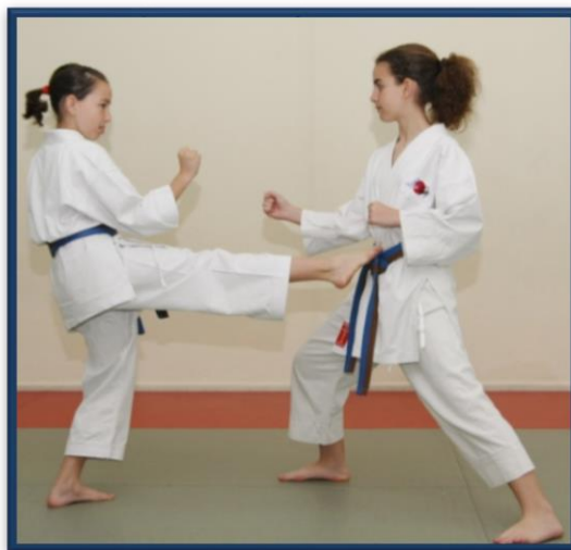
GEDAN BARAI + MAE GERI