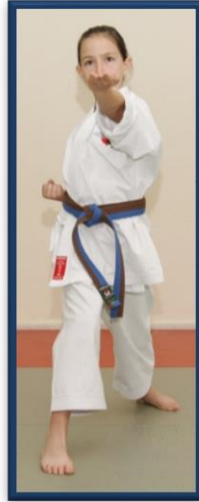
GYAKU SHUTO UCHI YODAN