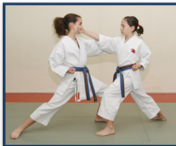
UCHI UKE + GYAKU URAKEN UCHI