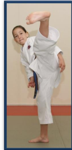
YOKO GERI KEAGE