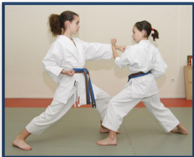
OI TSUKI CHUDAN