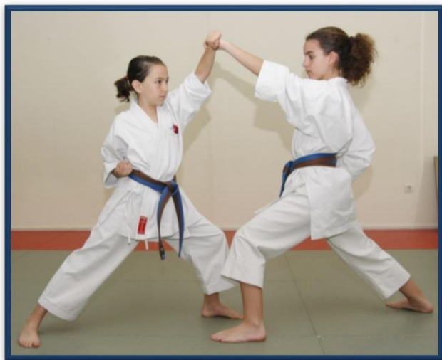
OI TSUKI YODAN